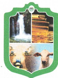
UILSON JOSÉ DA SILVA Prefeito Municipal

Nova Lacerda – MT, 26 de fevereiro de 2024.